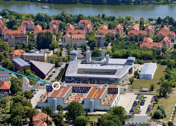
Änderungen vorbehalten. Gestaltung: LayoutManufaktur.com